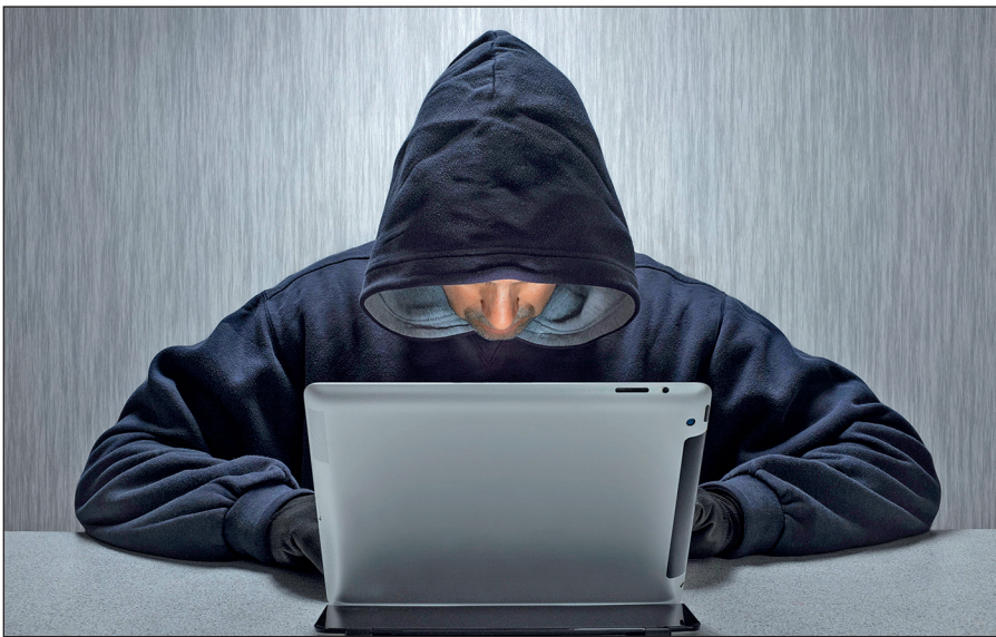
Вербовщики ИГИЛ активно используют Интернет.

Террористы день ото дня совершенствуют методы вербовки новых сторонников, а также алгоритмы их идеологической обработки. Читателю стоит помнить, что те типовые ситуации, которые описаны в данном пособии, можно рассматривать лишь в качестве базовых ориентиров,