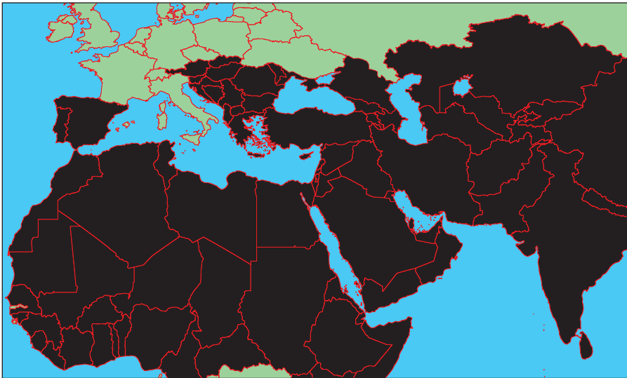
Карта мироустройства ИГИЛ

В настоящий момент группировка контролирует часть территории Сирии, а также ряд провинций в Ираке.