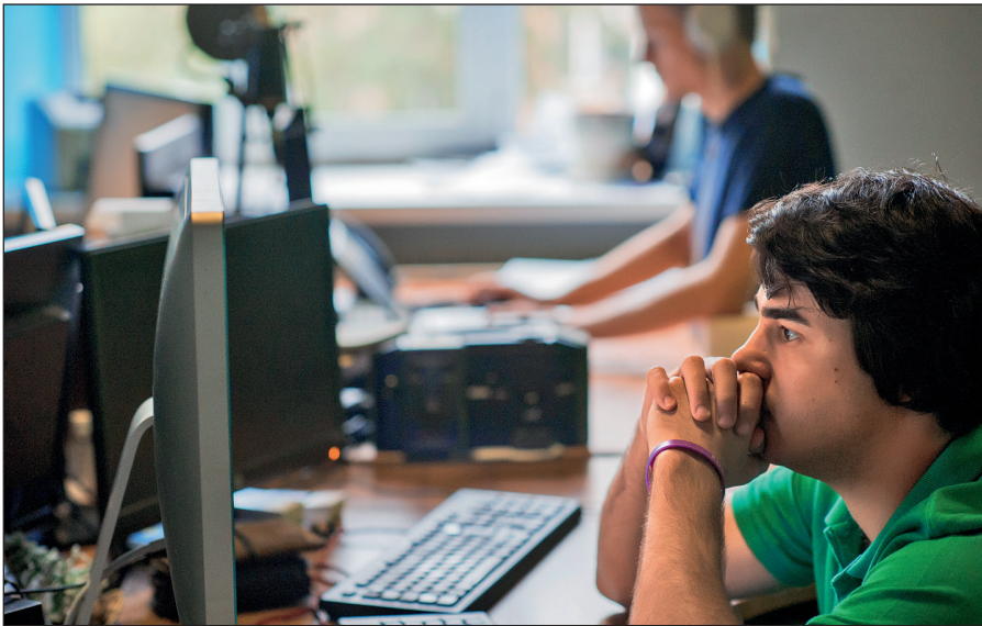
Постоянное присутствие вербовщиков ИГИЛ в соцсетях.

Активисты ИГИЛ поддерживают свои аккаунты в сетях Facebook, Twitter, Instagram, Friendica, Telegram. Активно они заявили о себе и в российских социальных сетях: «ВКонтакте» и «Одноклассниках».